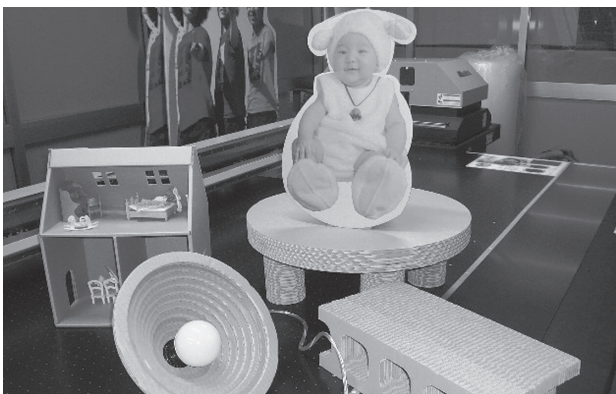
これら全て段ボールで製作！

「こんな製品ができないだろうか？」など相談も受け付けている。老舗メーカーが、段ボールの新たな可能性を切り拓いている。